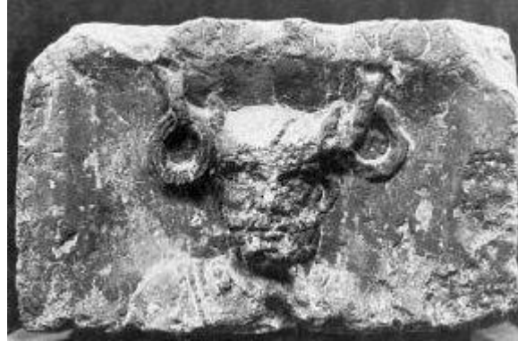
Retrato de Cernunnos en un relieve presente en el Pilar de los navegantes (Siglo I d. C.) Universidad de Colonia e Instituto Arqueológico Alemán (DAI)