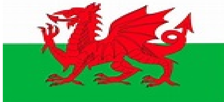
Bandera de Gales

En el Libro VII, Merlín interpreta el significado de ambos dragones y predice el futuro de la siguiente manera: el dragón rojo simboliza a los britanos o bretones, a los que Vortigern ha invitado a su reino. El dragón blanco, reprimirá y vencerá al rojo hasta que el jabalí de Cornualles expulse a los sajones (profecía que se cumple cuando el rey Arturo triunfando sobre los sajones, los expulsa de su territorio y el gobierno ilegítimo del traidor Vortigern es desafiado en el Libro VIII por el noble Ambrosius Aurelius y su hermano Uther Pendragon. El primero sucederá al caído tan pronto es asesinado.