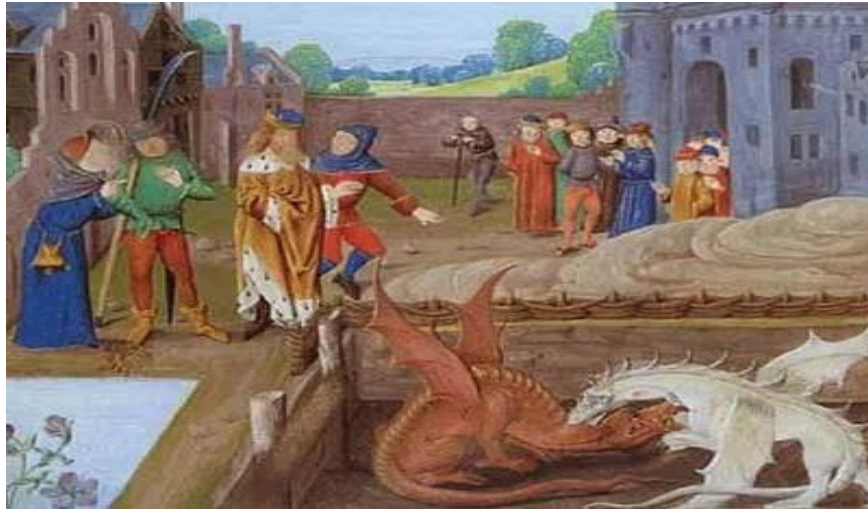
Vortigern se encuentra con Merlín

https://www.worldhistory.org/trans/es/1-18148/merlin/